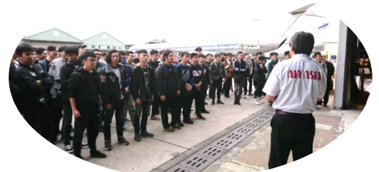
圖. 中華科技大學航空機械系參訪