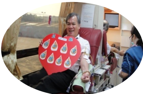
圖. 盧董事長帶頭挽袖捐血