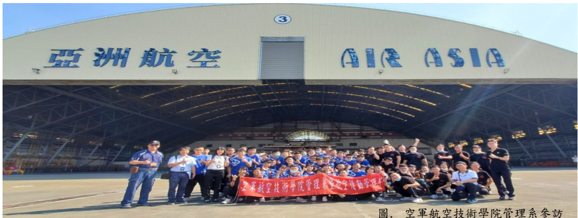
圖. 空軍航空技術學院管理系參訪