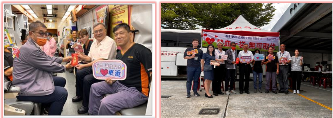
圖. 董事長響應捐血活動