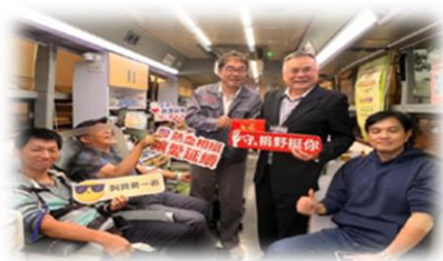
圖. 董事長帶頭挽袖捐血