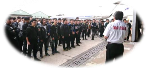
圖. 中華科技大學航空機械系參訪