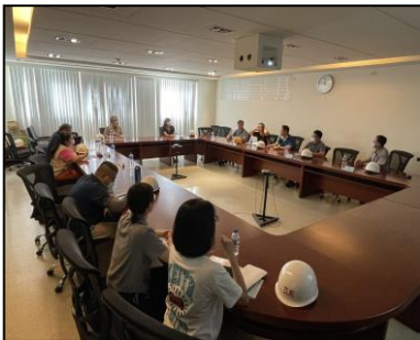
安衛家族執行成果

本公司董事長對於勞工權益及安全衛生特別重視，致力於發展與所有利益關係者共存共榮的「夥伴」關係，為彼此創造利潤與價值，追求永續經營。爰此，成立「亞航安衛家族」協助及輔導承攬廠商改善工作環境。我們追求永續經營與和諧的社會環境關係，重視提供員工健康、安全之工作場所，並致力於環境保護。我們遵守事業活動中所有環境、健康和安全(EHS)之法律法規，並制訂內部安全衛生工作守則，推動職場防災及減災作為，強化職場安全衛生，落實職場潛在危害之鑑別、評估與風險控制，確保工作安全與員工健康。本公司參加「事業單位無災害工時紀錄活動」，榮獲3次達到無災害工時目標獎勵，並於104-113年連續10年榮獲台南市勞工局列為優良安全文化促進單位，107-113年榮獲台南市勞工局安衛家族績效評選優等獎。