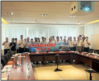
安全健康週宣示大會

為落實職場防災及減災，辨識職場潛在危害之鑑別、評估，及風險管控，建構安全及健康之職場環境，訂定「職場安全健康週活動實施計畫」每年 4-12 月推行「職場安全健康週」活動，針對職場安全健康週時期所宣誓或設定之目標，以及所辨識之危害及風險等級，採取預防與控制措施，並透過「教育訓練」、「診斷輔導」及「查核」等方式，強化職場安全衛生設施、健康環境與管理功能，保障工作者安全與健康。