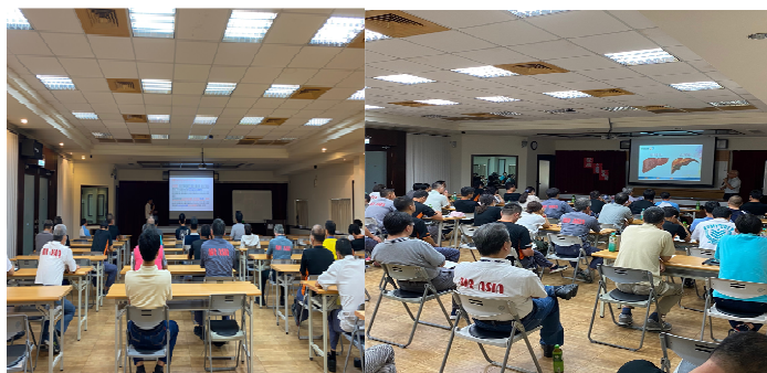
異常負荷健康衛教