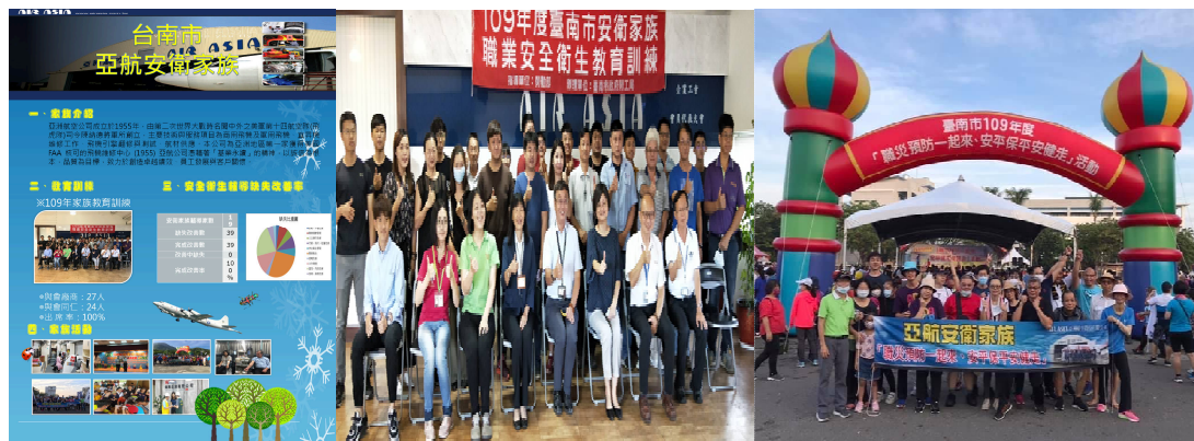
安衛家族執行成果

本公司董事長對於勞工權益及安全衛生特別重視，致力於發展與所有利益關係者共存共榮的「夥伴」關係，為彼此創造利潤與價值，追求永續經營。爰此，成立「亞航安衛家族」，協助及輔導承攬廠商改善工作環境。我們追求永續經營與和諧的社會環境關係，重視提供員工健康、安全之工作場所，並致力於環境保護。我們遵守事業活動中所有環境、健康和 safety (EHS) 之法律法規，並制訂內部安全衛生工作守則，推動職場防災及減災作為，強化職場安全衛生，落實職場潛在危害之鑑別、評估與風險控制，確保工作安全與員工健康。亞洲航空公司參加「事業單位無災害工時紀錄活動」，榮獲3次達到無災害工時目標獎勵，並於104~108年連續五年榮獲台南市勞工局列為優良安全文化促進單位，107、108、109年榮獲台南市勞工局安衛家族績效評選優等獎。